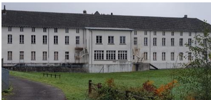
Aperçu du Mas Eloi à Chaptelat en mars 2023

Cette confiance accordée par Monsieur le Maire de Limoges et son conseil municipal est l'occasion de diversifier les offres d'insertion professionnelle déjà proposée aux personnes accompagnées par la Fondation, avec notamment la castanéiculture (culture de la châtaigne), la location de salles pour des événements, l'hôtellerie de plein air et le maraîchage.