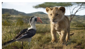
©2019 Disney Enterprises Inc. All Rights Reserved