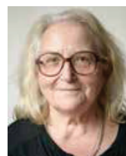
Corinne Ricoux Beaune-les-Mines Le Château d'eau Gérard-Philippe Beaubreuil