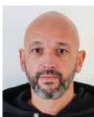
Lionel Antunes Le Grand Treuil La Brègère