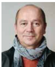
Frédéric Harlot Montplaisir La Gare