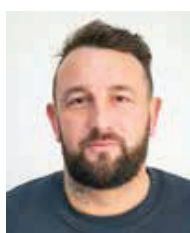
Virgile Ansel Le Puy Las Rodas Fustel de Coulanges