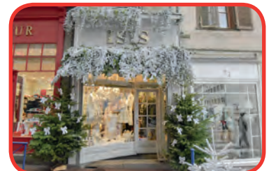
ISIS 3 ème prix de l'édition 2017