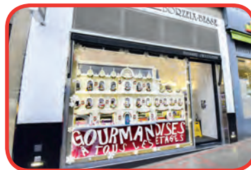
BORZEIX-BESSE Chocolatier 2 ème prix de l'édition 2017