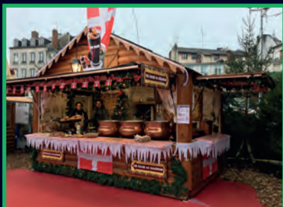
Verrio Christophe (chalet savoyard), 1 er prix de l'édition 2017

18 chalets gourmands de restauration seront également installés sur les secteurs d'animations de la place Saint-Pierre et de la place de Bancs ( détail des animations p.7 et 9 ).