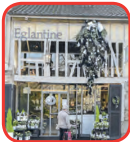
Eglantine 1 er prix de l'édition 2017

http://www.ville-limoges.fr/index.php/fr/economie-emploi/2018-10-17-07-45-52