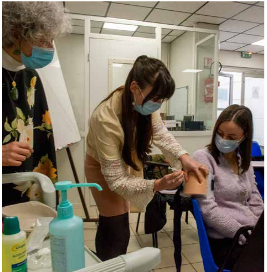
Première véritable injection réalisée pour de faux pour les étudiants qui ont suivi la formation vaccination Covid 19

Nous avons un mannequin haute fidélité pour nous entraîner à la réanimation du nouveau né. En complément, des ateliers sont proposés pour réviser les gestes en travaux pratiques et dès la 3 e année, des mises en situation avec des paramètres variables sont organisées