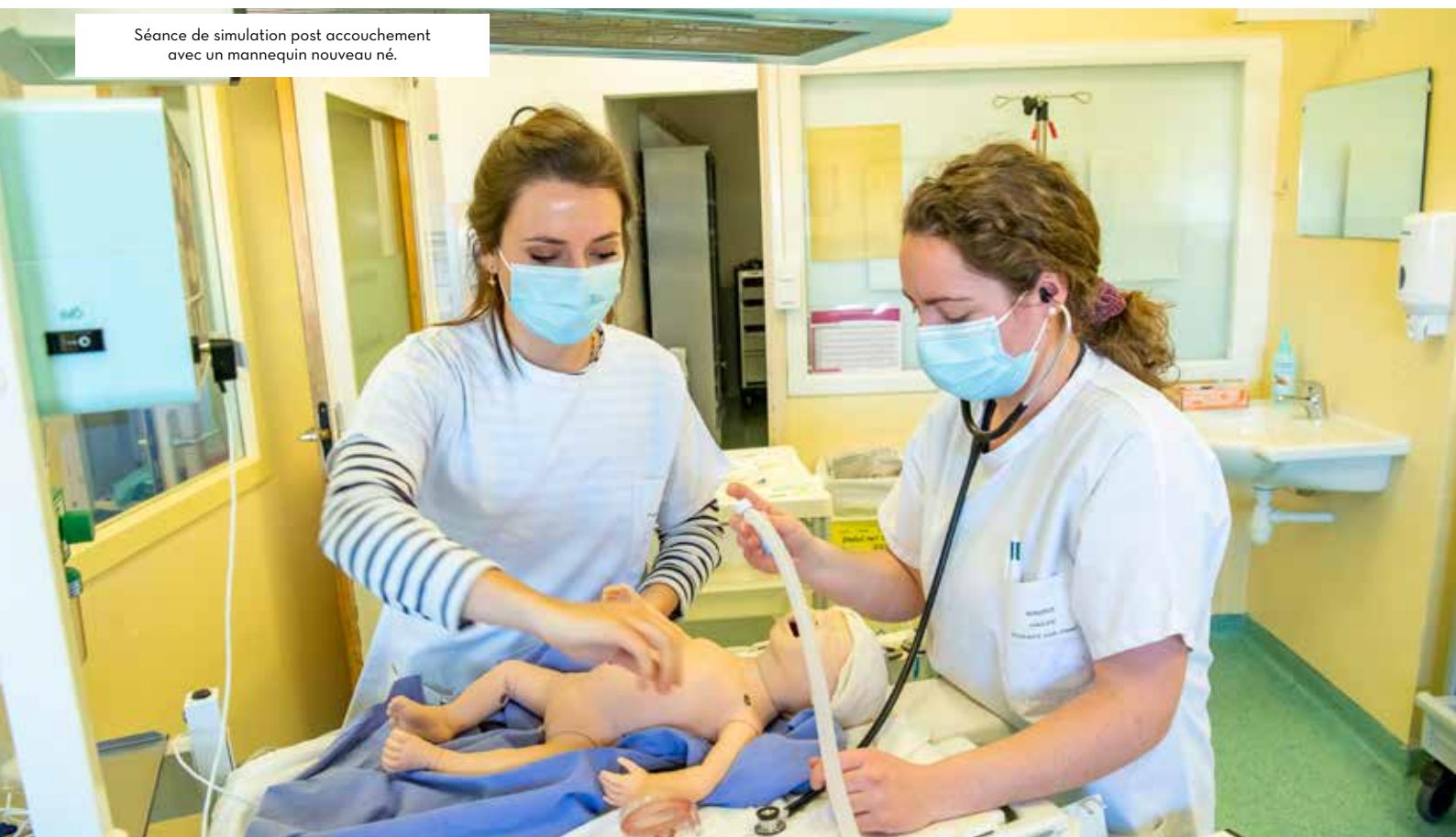
Séance de simulation post accouchement avec un mannequin nouveau né.