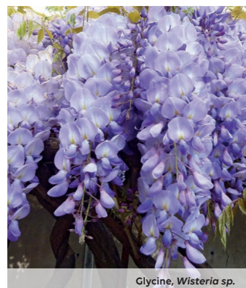
Glycine, Wisteria sp.

Il propose une palette de couleurs reprenant l'héritage de l'ancienne roseraie. Pensé de façon durable, avec ses allées perméables qui favorisent l'infiltration de l'eau et une diversité végétale permettant de s'adapter aux changements climatiques, il est également géré comme tel. Des pratiques respectueuses de l'environnement et du vivant sont mises en œuvre, par exemple en limitant les exportations de déchets verts et en recyclant la matière. De ce fait, il n'est plus question de déchets mais d'une ressource valorisée. Les nouvelles plantations s'accordent dans une joyeuse biodiversité, offrant tout leur éclat au fil des saisons.