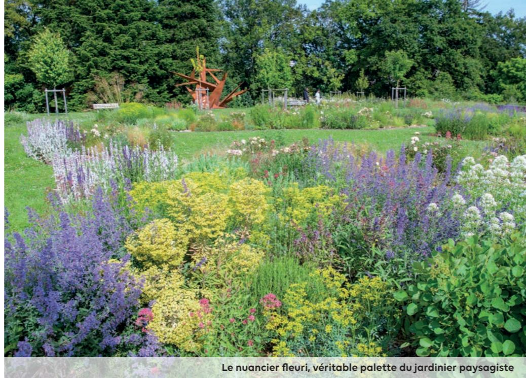
Le nuancier fleuri, véritable palette du jardinier paysagiste