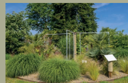
L'enclos des fibres