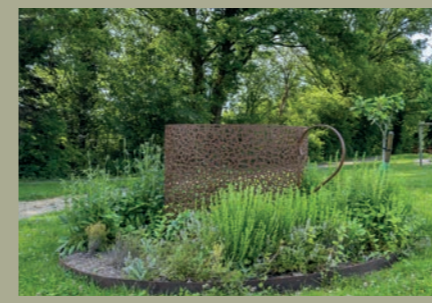
L'arôme des tisanes

ou classiques, soit 175 variétés réparties sur 1 200m 2 de massifs. L'histoire de la rose s'y découvre grâce aux variétés anciennes. Refondue et réaménagée à partir de 2019, la Roseraie a offert ses collections à la roseraie des Vaseix où elles sont aujourd'hui exposées au public.