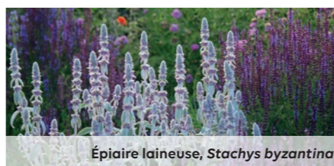
Épiaire laineuse, Stachys byzantina

Ce jardin vise à transmettre des connaissances , laissant le visiteur libre de choisir son sens de découverte du monde végétal. Chaque univers thématique propose une mise en scène adaptée au propos. Les cheminements invitent à serpenter dans ces univers sensoriels et pédagogiques, autour des thèmes de l'alimentation de la parfumerie, ou encore de la santé.