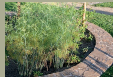
Les saisons gourmandes : le fenouil