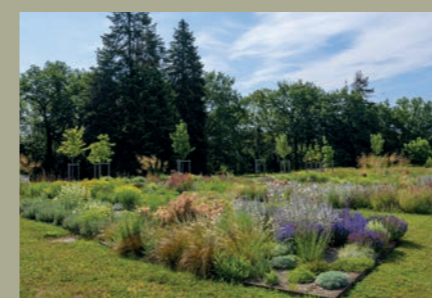
Le nuancier fleuri