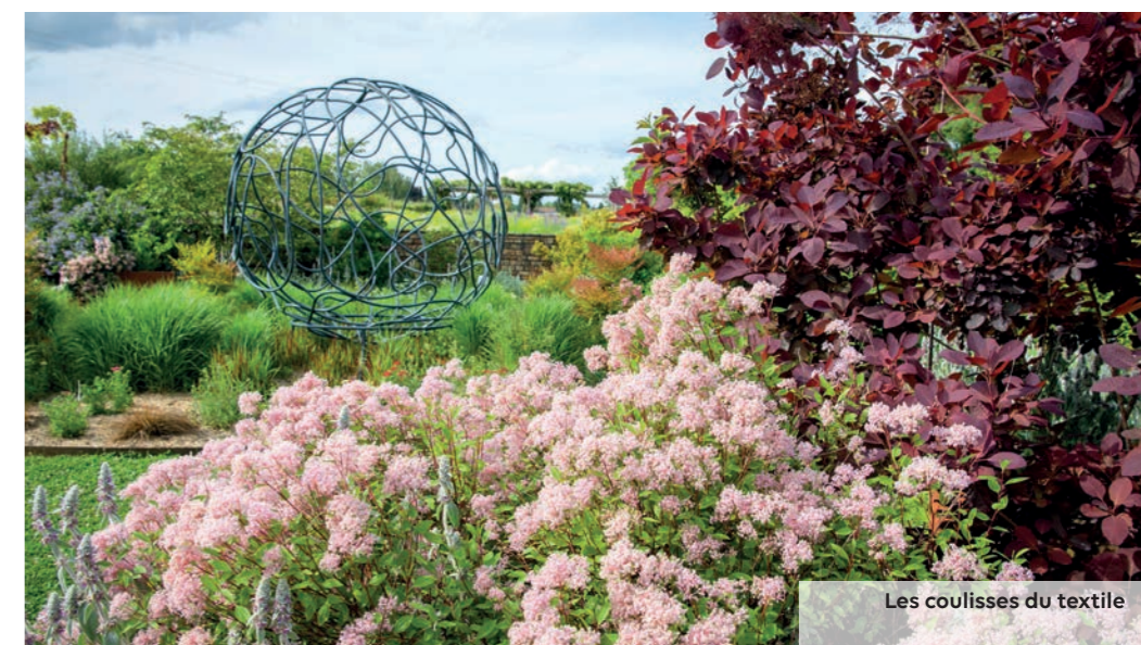
Les coulisses du textile

Depuis l'Antiquité, la sauge est utilisée pour les vertus de ses feuilles velues. C'est une plante médicinale, olfactive, tinctoriale et même comestible.