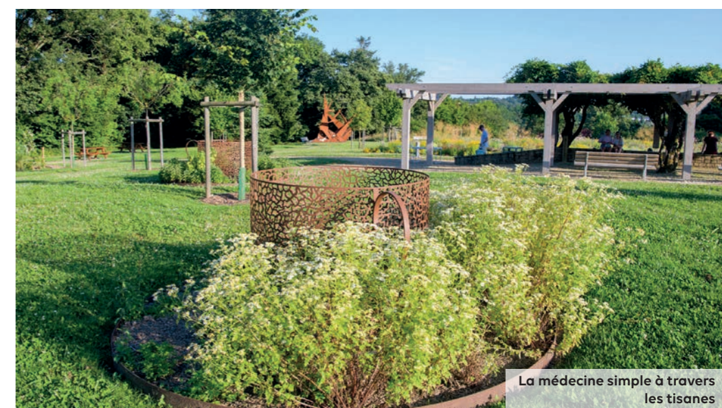
La médecine simple à travers les tisanes