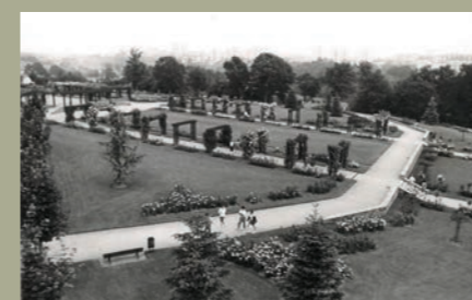
L'ancienne roseraie dans les années 80