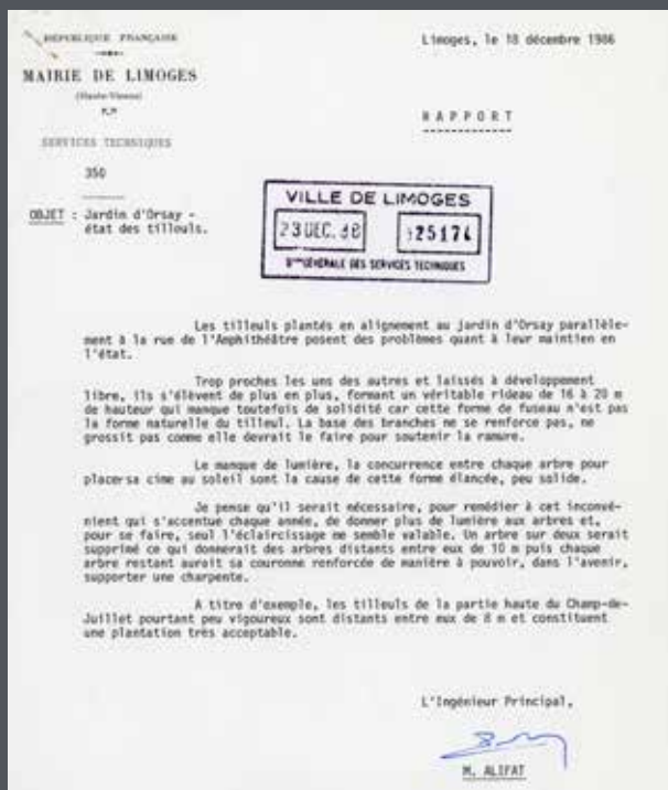
Rapport de l'ingénieur principal des services techniques.

Au Jardin d'Orsay, ne cherchez pas l'ombre côté rue de l'amphithéâtre, un sous-dossier conservé aux Archives municipales retrace l'existence de tilleuls aujourd'hui disparus. Plantés trop proches les uns des autres, un rapport de l'ingénieur principal des Services techniques du 18 décembre 1986 expose l'état problématique des tilleuls du Jardin d'Orsay. Ce document d'archives s'accompagne d'un reportage photographique illustrant l'alignement des arbres ainsi que les vues d'un projet d'éclaircissage