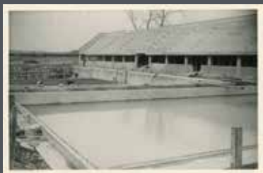
6Fi1991 Piscine d'été de Beaublanc en construction. Vue d'ensemble du chantier de la piscine extérieure avec deux bassins et, à droite, les gradins pour le public (1950).

Projet de l'architecte de la Ville, André Pécaud, la piscine extérieure de Beaublanc accueillait déjà de nombreux visiteurs en quête de fraîcheur dès sa mise en fonction le 14 juillet 1950. Les Archives municipales conservent le dossier d'architecture ainsi que plusieurs photographies et cartes postales de cette réalisation.