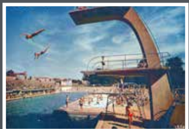
5Fi190 Le plongeur du bassin d'été. De 1950 à 1991, les plongeurs s'élançaient au-dessus des nageurs, face aux gradins (SD).