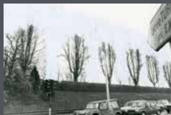
Vue de l'alignement des tilleuls et photomontage illustrant le projet d'éclaircissage des tilleuls.

Vous trouverez néanmoins d'autres zones ombragées au Jardin d'Orsay et dans les espaces verts de la Ville de Limoges pour affronter les températures estivales de cette année.