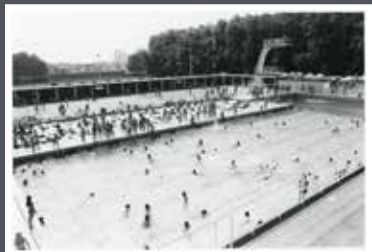
6Fi2085 Piscine d'été de Beaublanc. Vue sur le grand bassin, nageurs et baigneurs devant le plongeur de 10 mètres. À l'arrière-plan, on distingue un terrain de handball (juillet 1978).