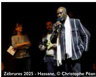
Zébrures 2025 - Hassane

La présentation sera suivie du spectacle Murmuration Equinoxiale , un road movie sonore et vivant qui convoque les oiseaux de Guyane dans leurs rapports aux humains, sur leurs endroits de vie communs.