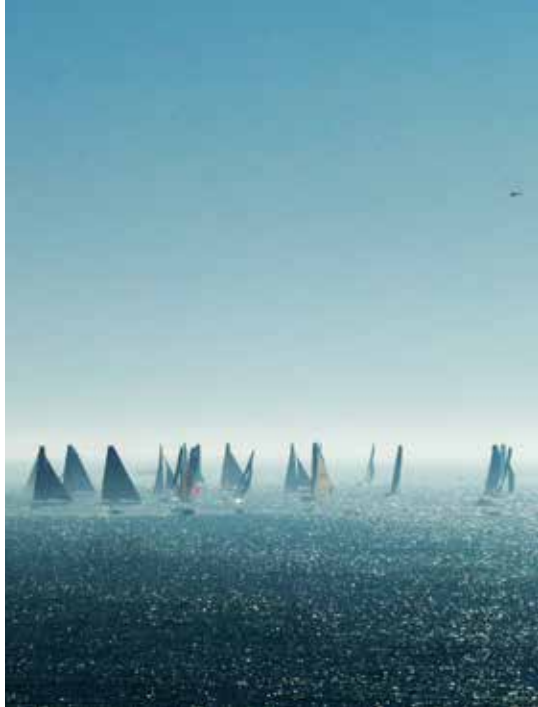
Les voiliers de Vendée

La situation privilégiée de la structure permettra aux enfants de découvrir de nombreuses activités de bord de mer avec l'activité voile qui sera l'activité phare du séjour... Vos enfants seront accueillis dans le centre de vacances AVEA, situé à proximité de la forêt domaniale et de l'océan, emplacement idéal pour la baignade et les jeux de plage.