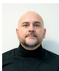
Cyril Nicolas La Cathédrale Montplaisir Les Coutures