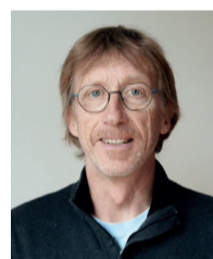
Frédéric Laforge Vincent Auriol Zup et Centre commercial Cognac Olivier de Serres Le Mas Bouyol