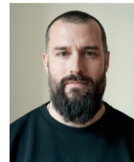
Jean-Marie Grousset Renoir Fustel de Coulanges