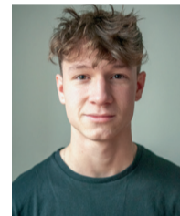
Dylan Harrau Révolution Ruchaud Curie