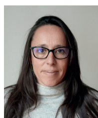
Sabrina Martin Le Puy Imbert Le Château d'eau Les Homérides ESTER